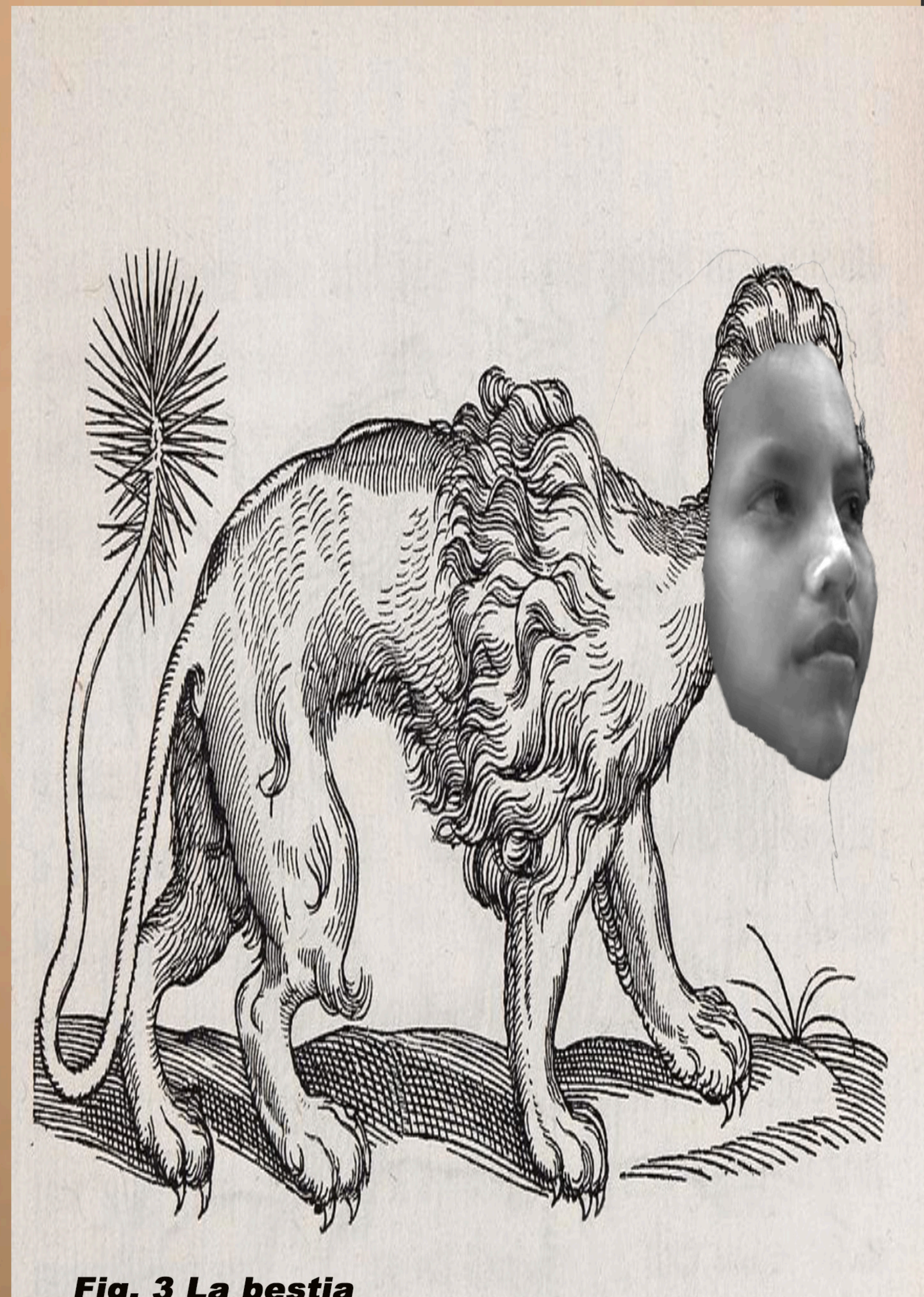
Fig. 3 La bestia