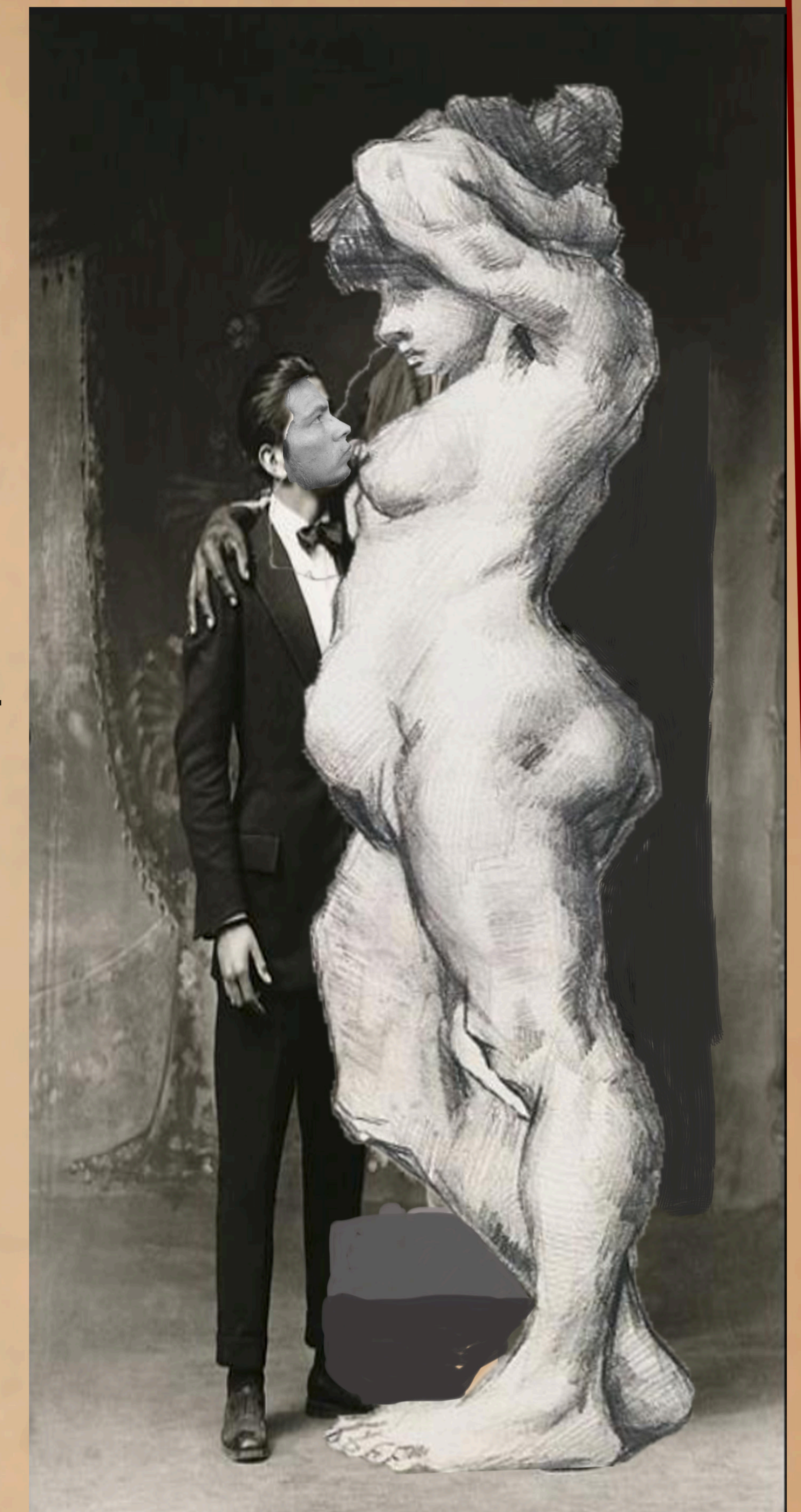
Fig. 4 Apoyo, piedad y fortaleza