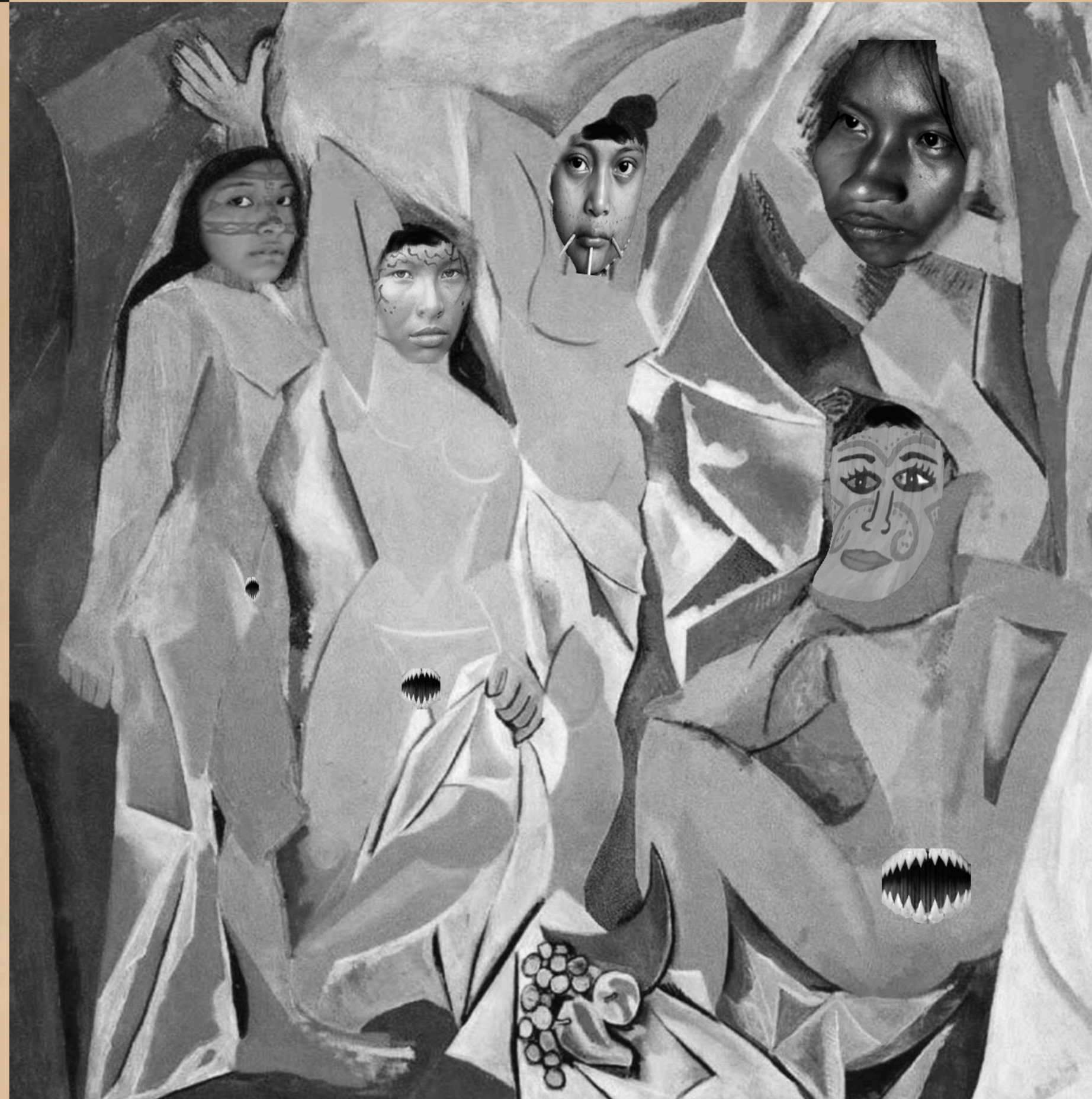
Fig. 2 Las señoritas del Beni