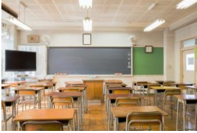
Une salle de classe

→ Activité 1 : regarde le début du clip. Barre le nom des lieux du collège que tu ne vois pas dans le clip.