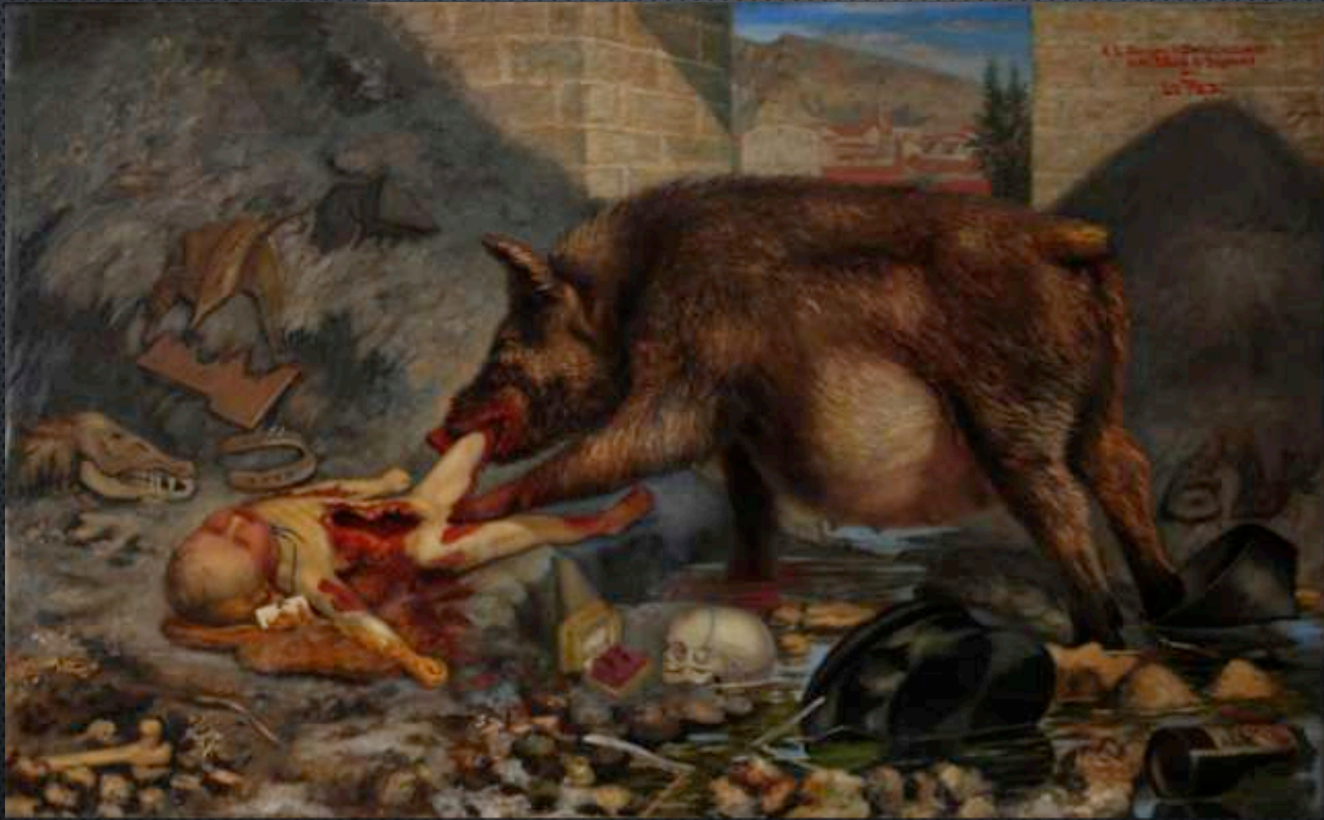
Arturo Borda, Filicidio , 1918.