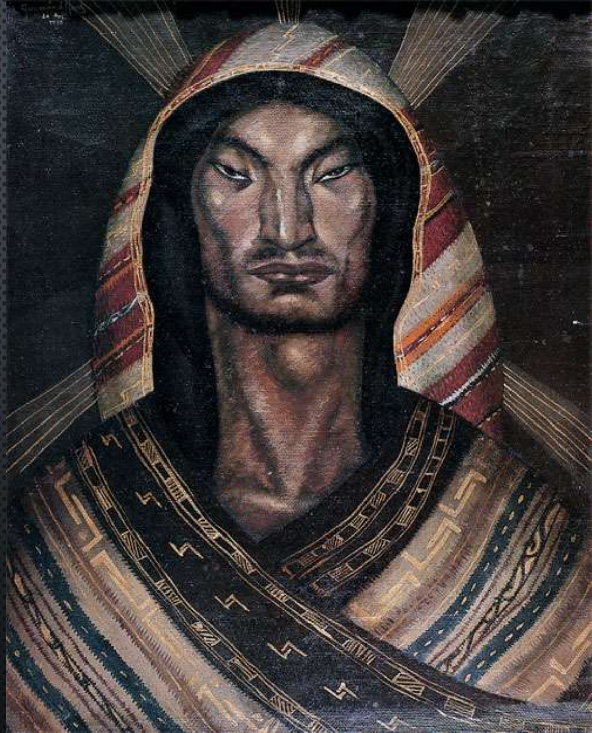
Guzmán de Rojas, Cristo aymara, 1939